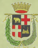
Provincia Regionale di Catania